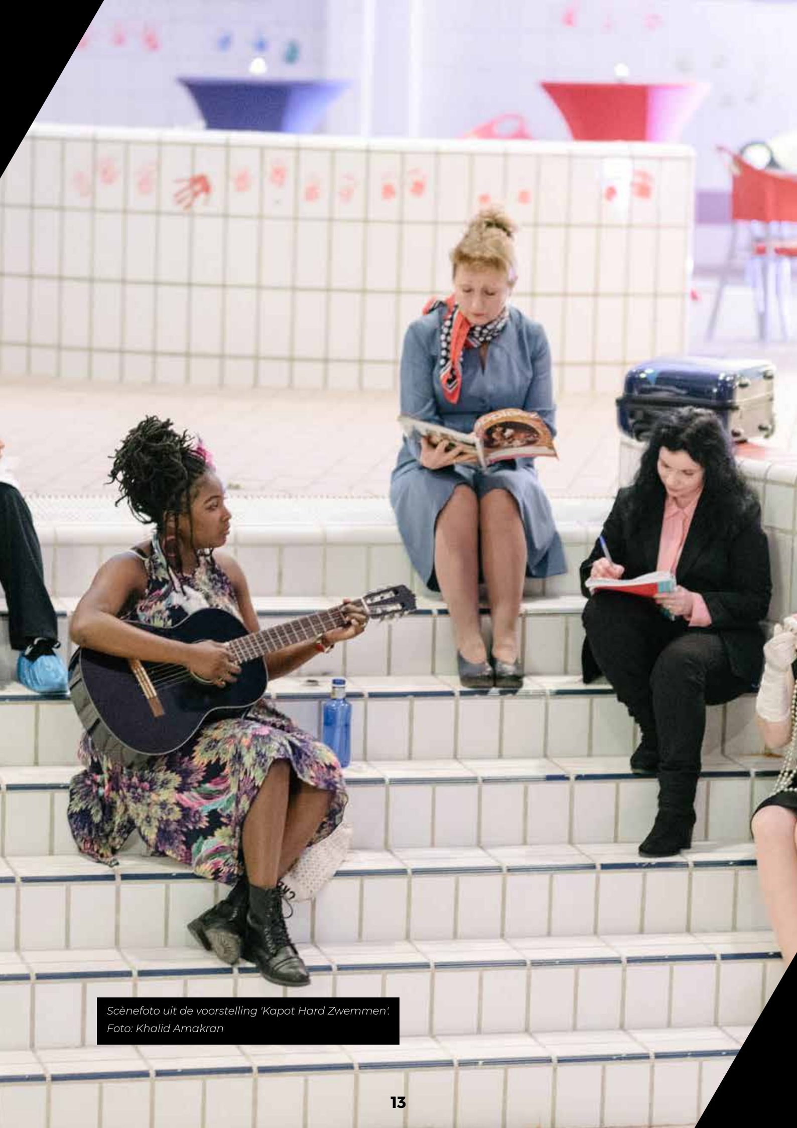
Scènefoto uit de voorstelling 'Kapot Hard Zwemmen'.