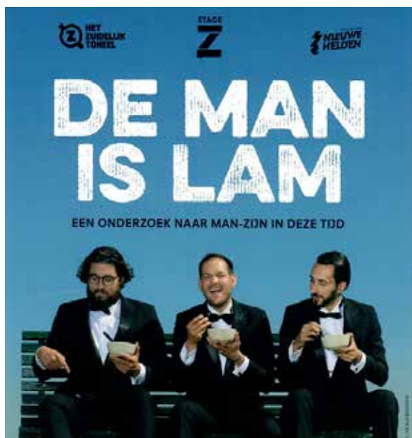
Campagnebeeld De Man is Lam

Naar aanleiding van het project De Man is Lam ontstond in het voorjaar 2017 de spin-off The Man Squad . The Man Squad moest een breder en meer divers publiek meenemen in het doel van De Man is Lam : het vieren van de complexiteit van mannelijkheid. Ook ging het erom daarna de dialoog aan te gaan met het diverse publiek.