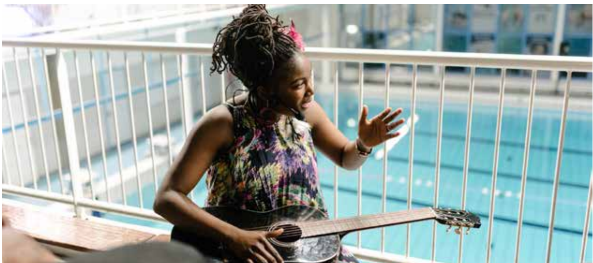
Scènefoto uit Kapot Hard Zwemmen .

In een dynamische voorstelling met dans werd het publiek geconfronteerd met hun eigen vooroordelen. Deze voorstelling, die werd geproduceerd met Lab-Z, de SKVR en DEGASTEN,