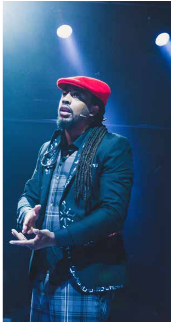
Scènefoto uit Alleen Staan De Vaders.

In deze voorstelling ging YMP op zoek naar wat het is om vader te zijn. Als co-ouder voedt hij zijn zoon deels alleen op. Maar hoe doe je dat als je in je jeugd zelf geen rolmodellen hebt gekend? Zijn zoektocht naar literatuur leverde niet veel op. Boeken over moederschap zijn er genoeg, maar over vaderschap amper. In het onderzoek voor de voorstelling heeft hij mannen (en enkele vrouwen) ondervraagd over wat vaderschap in hun ogen betekent. De uitkomsten en die uit zelfonderzoek, verwerkte hij in de voorstelling Alleen Staan De Vaders . Het is een cross-over voorstelling waar theater, spoken word , visuals en muziek hand in hand gaan. Deze voorstelling kwam tot stand in samenwerking met Lab-Z en Islemunda, podium van IJsselmonde. In 2018 vonden drie voorstellingen plaats met in totaal 458 bezoekers. In 2019 toert deze voorstelling nog langs enkele andere theaters.