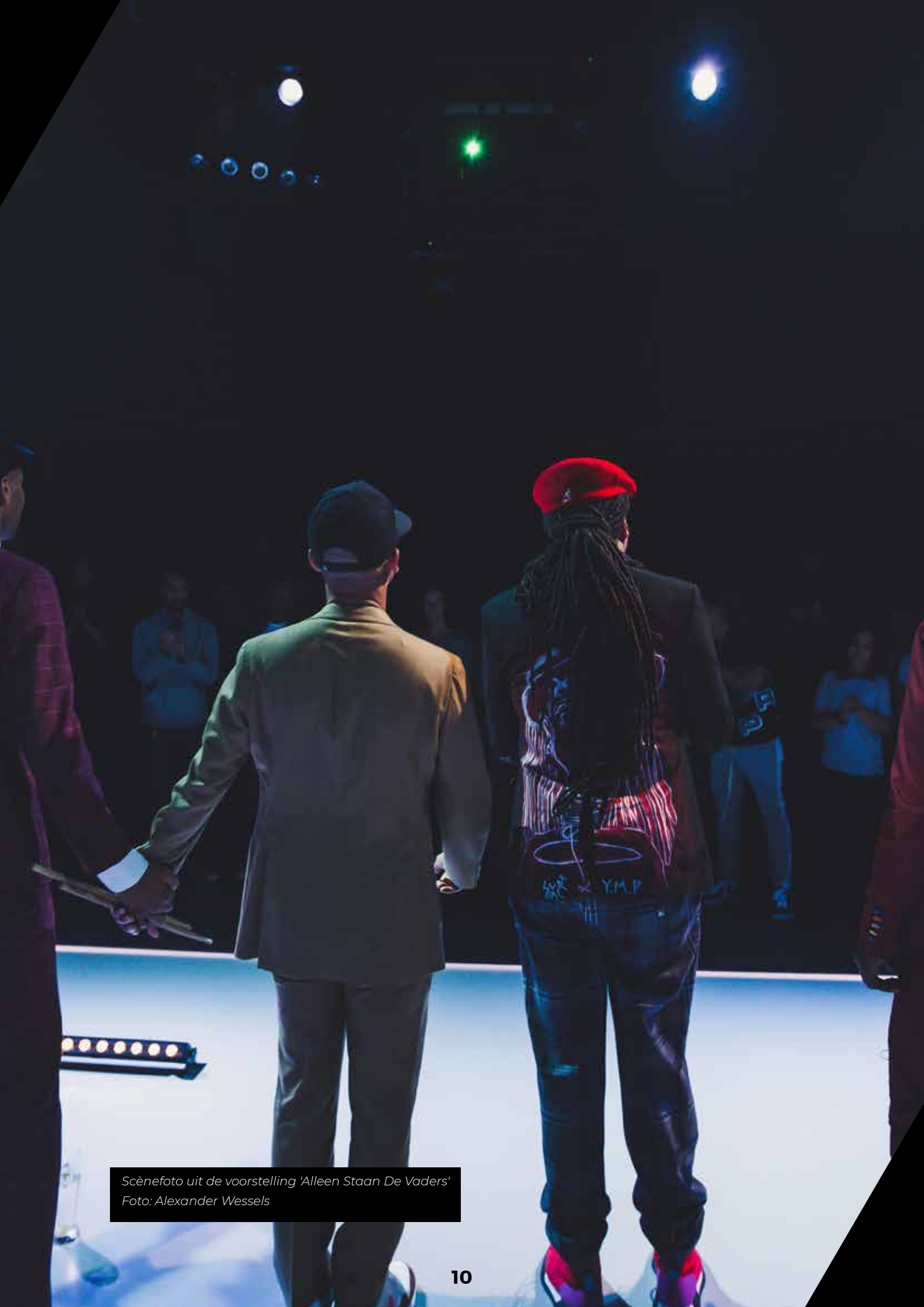
Scènefoto uit de voorstelling 'Alleen Staan De Vaders'