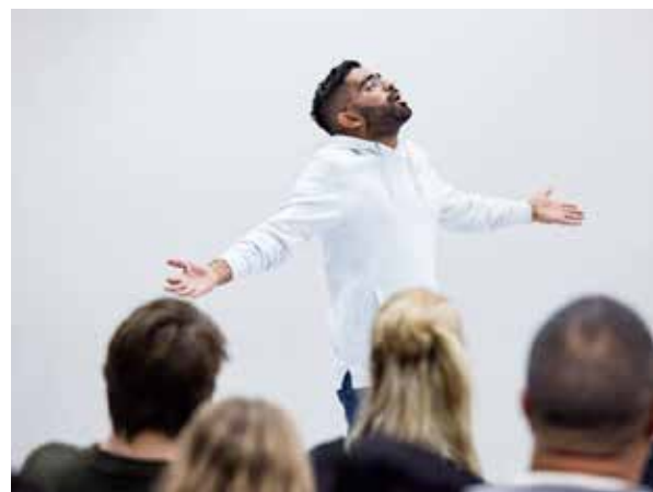
Scènefoto uit voorstelling 'Back to Back'

In 2018 waren twee voorstellingen te zien die met diverse partners (zie paragraaf 1.3) werden ontwikkeld. Stage-Z is in 2018 een meer intensieve samenwerking aangegaan met Lab-Z, het talentontwikkelingsprogramma van Theater Zuidplein. De winst: Lab-Z kan een doorlopende leerlijn realiseren en Stage-Z heeft nieuwe theatermakers.